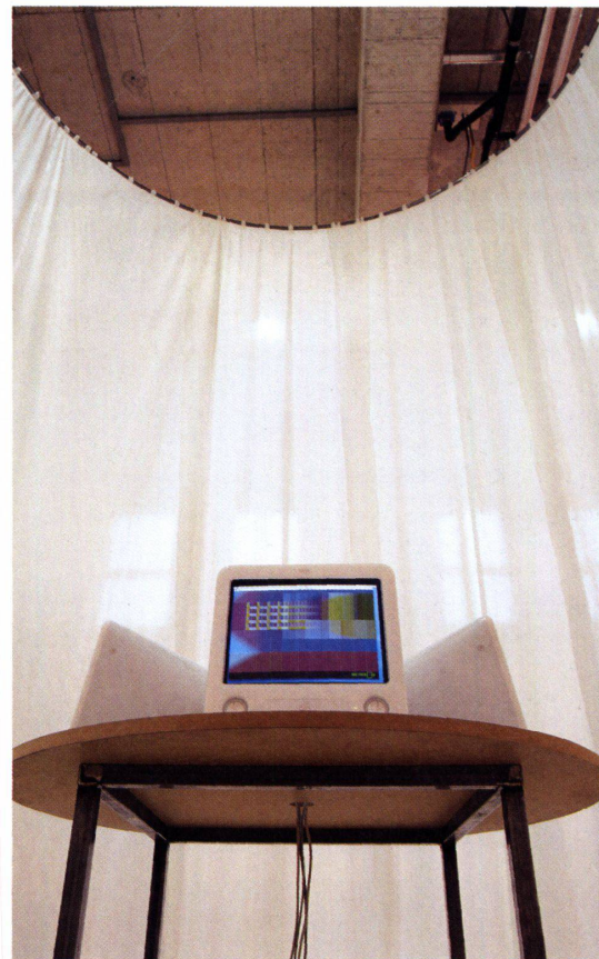
2 Derrière le rideau se cachent une table ronde équipée de quatre écrans et de souris pour les amateurs de clics.