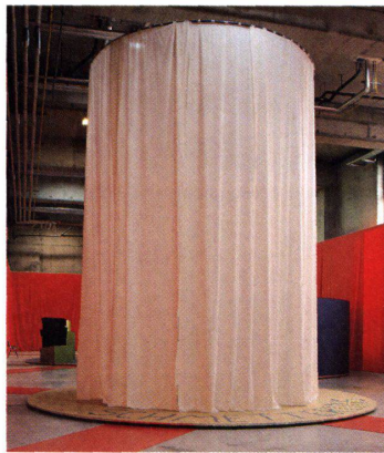
1 Un rideau mystérieux et presque sensuel enveloppe le centre de la plate-forme du papillon « Schmetterling ».