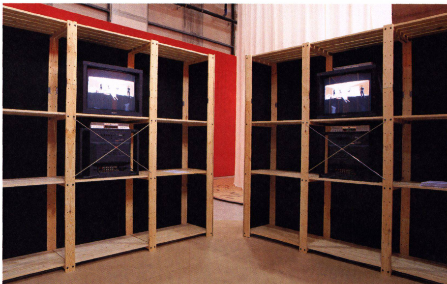
1 Des étagères ouvertes supportant quatre écrans, voilà l'espace intérieur du projet Architectures à Dispositions de l'EPFL.