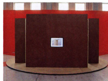
2 Les écrans montés sur les surfaces éveillent au dehors l'intérêt sur ce qui se passe à l'intérieur.