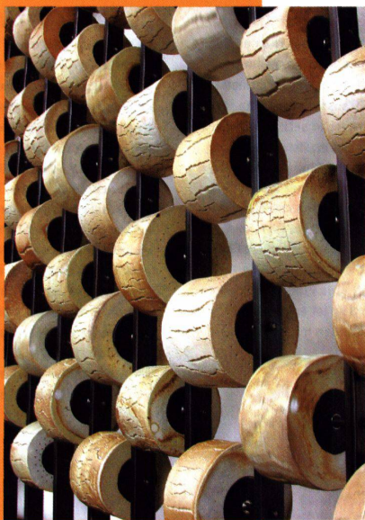
Klingende Tonmühlen Moulins à musique captivants