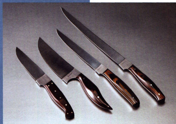
Edle Küchenmesser Couteaux de cuisine pleins de noblesse