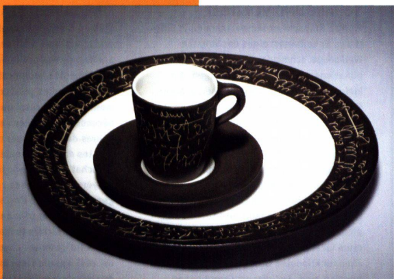
Teller und Tasse in Steinzeugton, engobiert glasiert Assiette et tasse en argile à grès