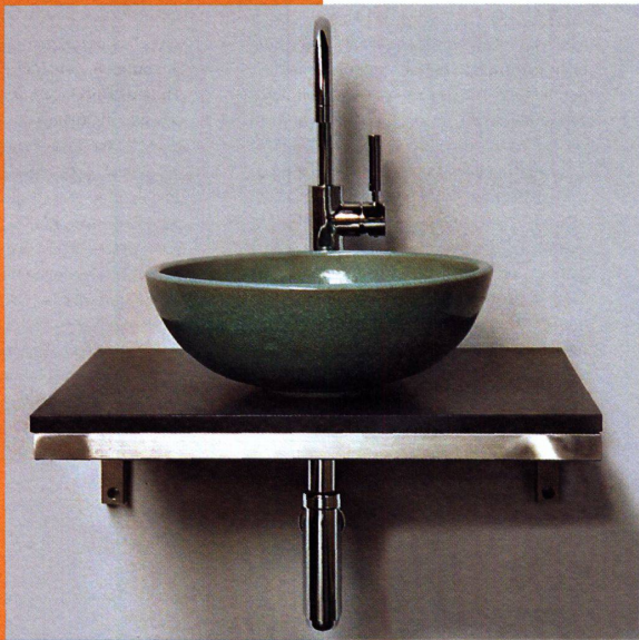
Aus der Kollektion «Lavabo Lavabelle» Collection «Lavabo Lavabelle»