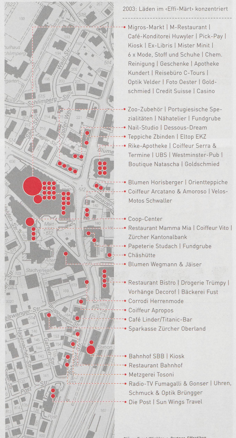
Pläne: Ernst Winkler + Partner, Effretikon