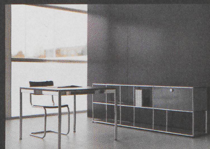
BÜROPLANUNG UND INNENARCHITEKTUR