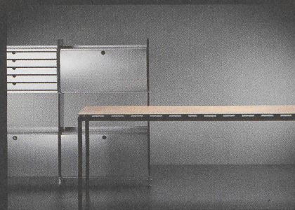
BERATUNG UND VERKAUF