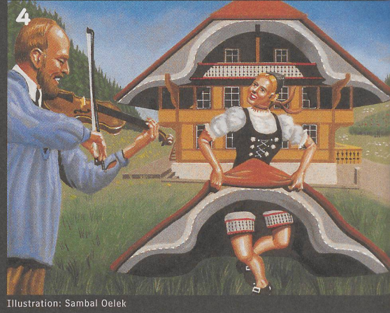
Illustration: Sambal Oelek