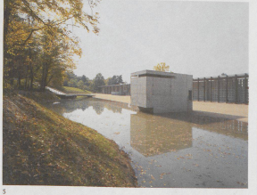
1-5 Magerwiese mit Mauer Spiegel von Barbara Mühlefluh, Himmelsplatz, Nischenwand, Himmelsleiter, Kapelle mit Teich, Brücke und 110 Meter langer Urnenwand