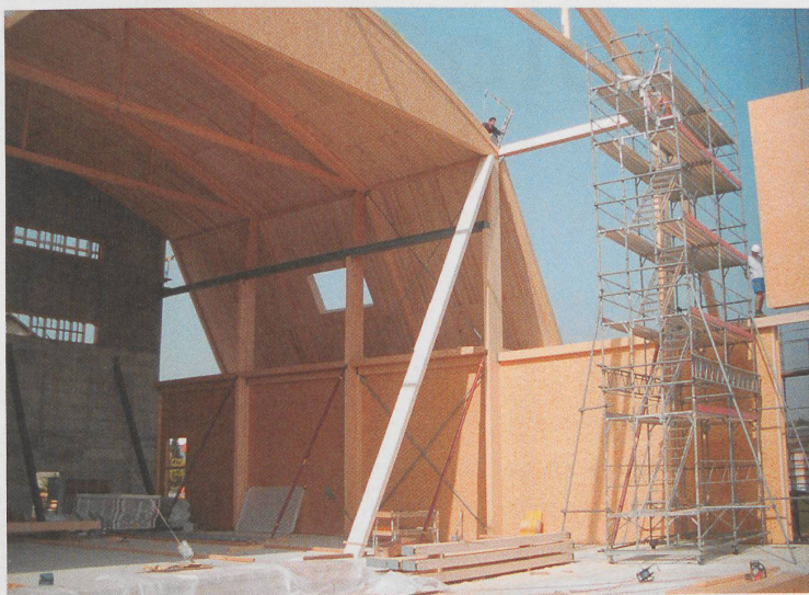
70 Prozent der Arbeiten finden heute in der Werkhalle statt. In die neue Produktionshalle der Victor Egger Holzbau in Langenthal sind Büros und Ausstellungsräume integriert. Eine Galerie führt den Besucher durch den riesigen Schauraum.

Bei den Spezialgebieten gibt ein Viertel der Mitglieder an, Systeme zu bauen, Holzrahmenbau führen 28 Prozent an. 4 Prozent besitzen eine eigene Abundanlage, über ein Ingenieurbüro verfügen 5 Prozent, eine CNC-Anlage steht bei 2 Prozent in der Werkhalle. 23 Prozent nennen als Spezialgebiet auch die Planung, 5 Prozent den Brettstapel-, 4 Prozent den Holzleimbau.