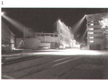
1-2 Macht des Lichts: Die Installation von Siegrun Appelt taucht das Maag-Areal in immer wieder andere Lichträume.