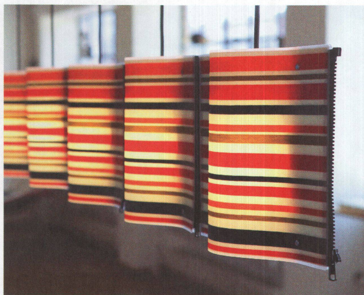
3-4 «Sparkling» ist eine Leuchte, die sich beliebig koppeln lässt. Die Schirme sind in allen erdenklichen Motiven erhältlich.