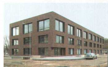
7 1-2 Nebenräume, Eingang und Treppen sind an den Stirnseiten angeordnet. Sie bilden eine Raumklammer für die Lagerhalle.