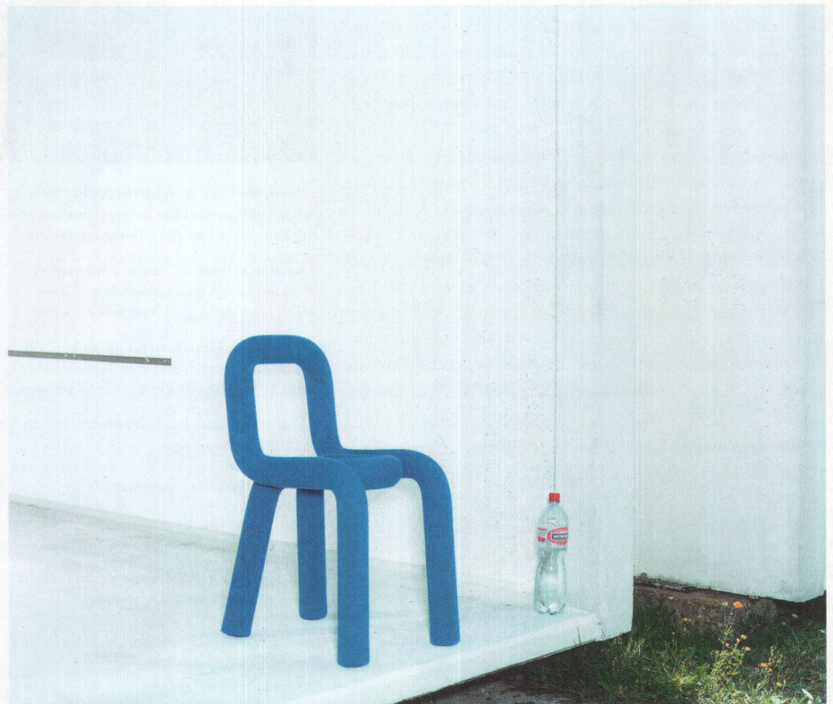
Der Stuhl «Bold», entworfen von Big-Game: zwei u-förmige Stahlrohre, über-zogen mit einer Wollsocke.