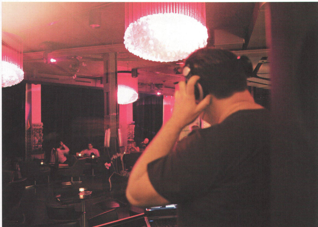
1-2 In der Nacht sorgen opulente Muschelluster mit Brillanz und Farbwechseln für die richtige Clubatmosphäre.

Was für den architektonischen Körper unter dem Sonnenlicht selbstverständlich erscheint, soll auch für den Innenraum gelten: dass dieser als Landschaft erst unter dem Kunstlicht seine Atmosphäre erhält. Der Versuch Morettis, den Wunsch nach der geistigen Klarheit einer modernen Volumenkonzeption mit dem nach Empfindung verlangenden Auge auszusöhnen, findet sich auch in einer aktuellen künstlerischen Strategie wieder: die Verknüpfung einer Kunst der (Abstraktion) mit einer Kunst der (Einfühlung). Stimmiges Beispiel dafür ist die hypnotisierende Arbeit (The Weather Project) des dänischen Künstlers Ólafur Elíasson: Durch die Simulation einer riesigen Sonnenscheibe im Innenraum der Tate Modern in London sind Kunstwerk und Betrachter, konzeptionelle Reinheit und theatralische Stimmung, Tages- und Nachtlicht plötzlich keine Gegensätze mehr. •