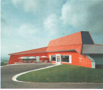
1 1-2 Golf Sempachersee, 2007

→ weil ich es langweilig finde, wenn ich mich mit mir selber unterhalten muss. Die interessantere Welt ist die komplexere, denn das Radikale ist banal. Die mehrschichtige Sicht des Verhältnisses von Haus und Umgebung ist letztlich stärker und suggestiver. Auf einmal entsteht etwas Überraschendes. Etwa ein Gebäude, das als eigene Welt für sich selber existieren will. Es geht darum, die spezifischen Qualitäten der verschiedenen Welten zu entdecken, und darum, dass man die verschiedenen Qualitäten auch akzeptiert – egal ob das eine Autobahn ist oder ein Golfclub. Man kann sich dagegen wehren oder man lässt sich darauf ein, um diese Welt kennenzulernen. Das Interesse an Identität ist die Suche nach Suggestivität, nach Energetik, nach Ausstrahlung, nach Einzigartigkeit.