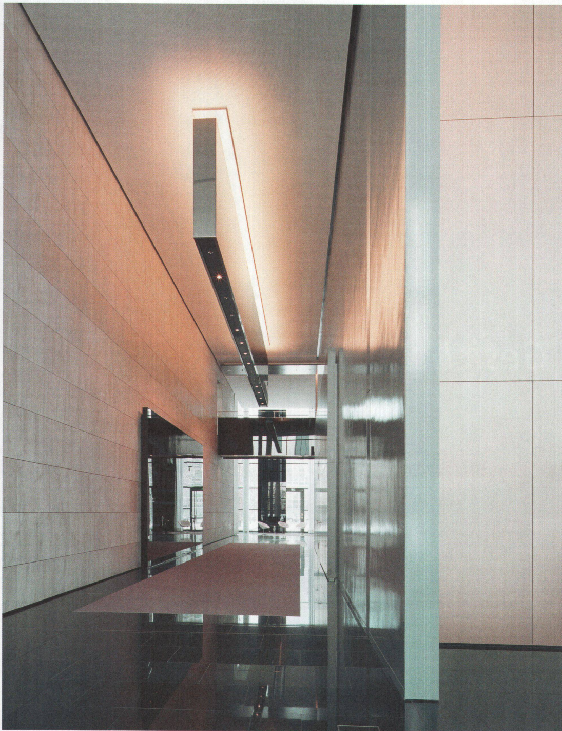
3 Büros Ernst & Young, Frankfurt / Main, 2006

In seiner Herstellung muss ein Raum aus verschiedenen Schichten zusammengesetzt werden. Jedes einzelne architektonische Phänomen muss aber auch in sich stimmig sein, jedes Element wird wichtig für das Ganze. Indem ich die Welt studiere und sie rekonstruiere, schaffe ich Bedeutung. Letztlich wird der Raum aber als Ganzheit erlebt. •