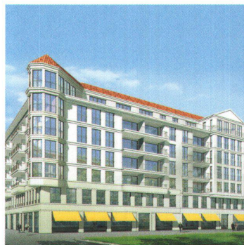
Limmatfeld: Baufeld B, 2010 36

Der Grundriss dieses Wohn- und Geschäftshauses ist gestaffelt und kammartig aufgespaltet; begrünte Höfe schaffen Abstand. Das Erdgeschoss enthält Verkaufsflächen, in den fünf Obergeschossen sind 66 Wohnungen mit 2 bis 5 Zimmern geplant. Der Kopfbau an der Ecke Überland-/Heimstrasse ist für Büro- und Gewerbeflächen vorgesehen. --> Architektur: Krischanitz ZT GmbH, Wien/Zürich --> Projektentwicklung: Halter Entwicklungen, Zürich --> Auftragsart: Studienauftrag --> Investitionsvolumen: CHF 55 Mio. --> Stand: Baugesuch eingereicht; Baubeginn geplant 1. Quartal 2009