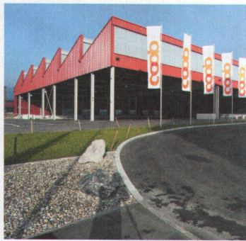
Coop-Megastore Silbern, 2004 31

Anfang der Achtzigerjahre erstellte die Firma Pestalozzi das Haus für eigene Zwecke: im Erdgeschoss die Maschinenhalle, in den Obergeschossen die Büros. Zehn Jahre später wurde das Gebäude um zwei Geschosse aufgestockt. Heute belegt der Eigentümer vier Geschosse. Im Erdgeschoss hat sich kürzlich Möbel-Märki eingemietet und manifestiert zusammen mit dem Grossverteiler vis-à-vis den Wandel vom Industriequartier zum Gebiet Silbern. --> Adresse: Riedstrasse 1 --> Bauherrschaft: Pestalozzi --> Architektur: Suter + Suter, Urs Hürner, Zürich