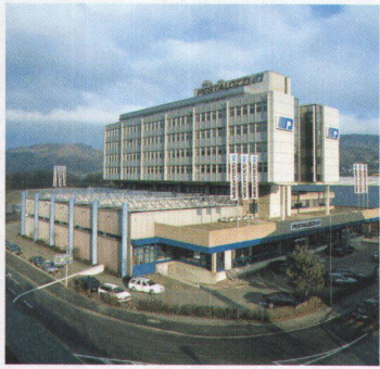
Pestalozzi-Haus, 1981, 1991 30

Anfang der Achtzigerjahre erstellte die Firma Pestalozzi das Haus für eigene Zwecke: im Erdgeschoss die Maschinenhalle, in den Obergeschossen die Büros. Zehn Jahre später wurde das Gebäude um zwei Geschosse aufgestockt. Heute belegt der Eigentümer vier Geschosse. Im Erdgeschoss hat sich kürzlich Möbel-Märki eingemietet und manifestiert zusammen mit dem Grossverteiler vis-à-vis den Wandel vom Industriequartier zum Gebiet Silbern. --> Adresse: Riedstrasse 1 --> Bauherrschaft: Pestalozzi --> Architektur: Suter + Suter, Urs Hürner, Zürich