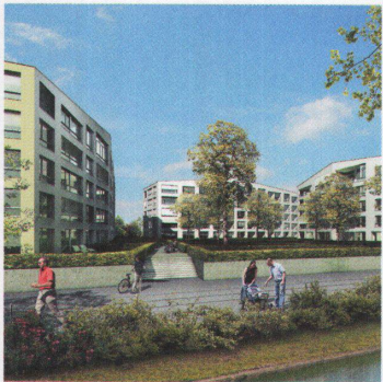
Limmatfeld: Erlenhof, 2009 34

Zurzeit arbeiten in Dietikon bei den Elektrizitätswerken des Kantons Zürich 220 Personen. In Zukunft sollen es 340 sein. Neu entstehen zwei Gebäude: Ein Büro- und Werkstattgebäude und die neue Betriebsführungsstelle (Foto). Das bauliche Wahrzeichen ist das Kernstück der Stromversorgung des Kantons Zürich mit einem Netz von 13000 Kilometern. Von hier aus werden ab Herbst 2009 Netz, Unterwerke und Transformatoren überwacht und gesteuert. --> Adresse: Überlandstrasse 2 --> Bauherrschaft: EKZ Elektrizitätswerke des Kantons Zürich --> Architektur: Karl Steffen, Zürich