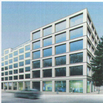
Limmatfeld: Baufeld A, 2010 35

Erstes sichtbares Zeichen des Wandels im Limmatfeld ist der Erlenhof: Die 3 Gebäude, die zurzeit im Bau sind, umschliessen einen mit Erlen bepflanzten Hof, der zum Oberwasserkanal hin offen ist. Von den 35 Miet- und 50 Eigentumswohnungen sind die meisten in zwei bis drei Himmelsrichtungen ausgerichtet. --> Bauherrschaft: PV Promea, Schlieren (Miete); Wohnbaugenossenschaft Blumenrain (Eigentum), Zürich --> Architektur: Gigon Guyer, Zürich --> Projektentwicklung: Halter Entwicklungen, Zürich --> Auftragsart: Studienauftrag --> Investitionsvolumen: ca. CHF 35 Mio. --> Bezug: Herbst 2009