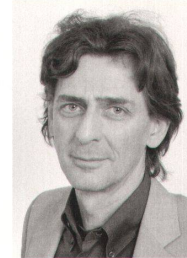
<Rainer Stadler