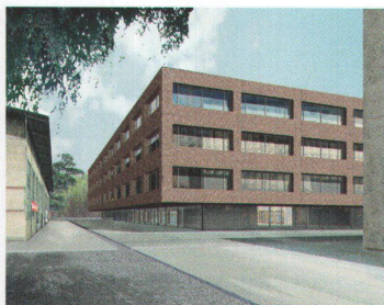
Von Roll-Campus, Bern