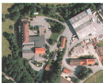
Fabrik am Rotbach, Bühler

Auf einem Teil des Von Roll-Areals im Länggassquartier bauten private Investoren Wohnungen. Drei bestehende Gewerbebauten werden weiter genutzt. Das übrige Areal will der Kanton Bern zum Campus für Uni und Pädagogische Hochschule umnutzen. 2004 fand dafür ein Architekturwettbewerb statt.