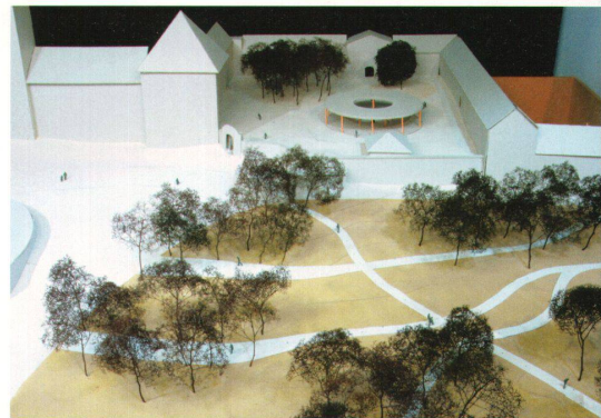
^Blick in den Weisswindgarten und in den Abteihof mit dem Pilgerunterstand.

Überhaupt: Wie umgehen mit der Steilheit des Platzes? 12 Meter liegt der Eingang der Klosterkirche höher als das Ende der Hauptstrasse. Um schräge Fläche in den Griff zu bekommen, haben die Landschaftsarchitekten von Günther Vogt ein Karton- und Sandmodell im Massstab 1:100 gebaut. Die Jury war überrascht, wie einheitlich das Projekt wirkt, trotz der vielen Teilbereiche. Der offene Raum ist das Verbindende, neuer Horizont ist der Klosterwald und nicht mehr die Mini-golfanlage. Kritik äussert sie bei der Gestaltung des Abteihofs. Der sei noch zu überladen und der Pilgerunterstand zu gross.