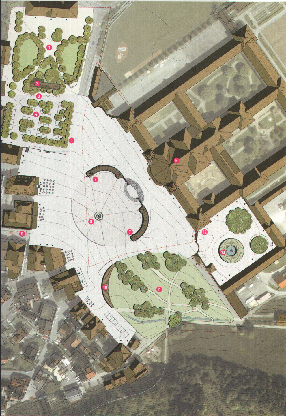
^ Masterplan mit eingezeichnetem Wettbewerbsgebiet: Das Siegerprojekt formt um den Marienbrunnen einen «Platz im Platz».