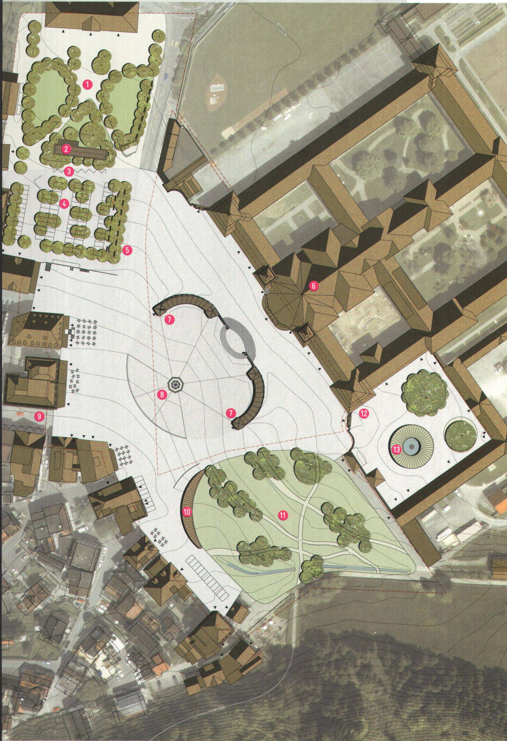
^ Masterplan mit eingezeichnetem Wettbewerbsgebiet: Das Siegerprojekt formt um den Marienbrunnen einen «Platz im Platz».