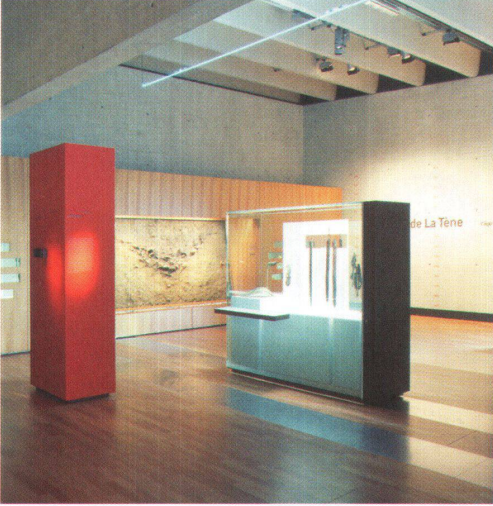
^ Fundgegenstände werden in Vitrinen inszeniert.