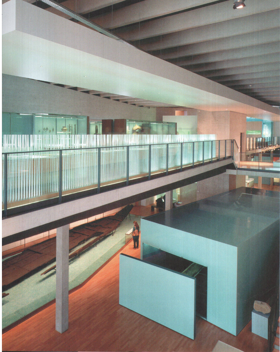
«Atelier Oï entwickelte eine «Mikroarchitektur». Sie erleichtert die Orientierung im Innern des Gebäudes und führt durch die Ausstellung.