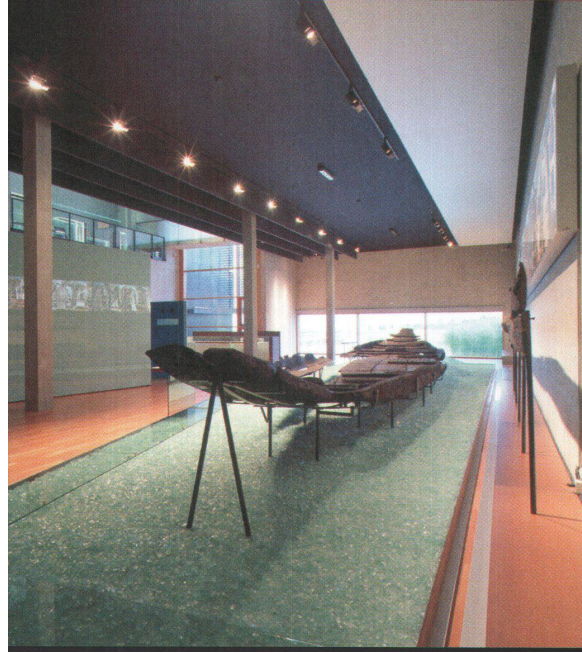
◀ Das rekonstruierte gallo-römische Schiff steht auf einem Bett aus Glassplittern.