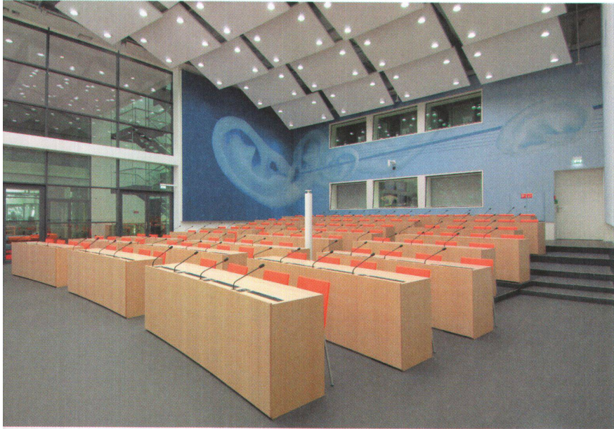
^ Pultreihen für die Medienschaffenden.