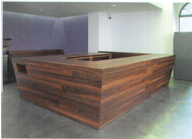
◁ Der Beratungskorpus steht im Zentrum.