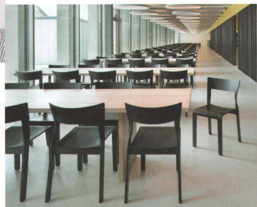
^ Stuhl «Torsio» von Hanspeter Steiger.