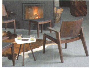
∨ Sessel und Beistelltisch «Muscat» von Greutmann Bolzern.