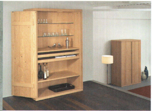
^ Schrank «Plusminus» von Hans-Jörg Ruch.