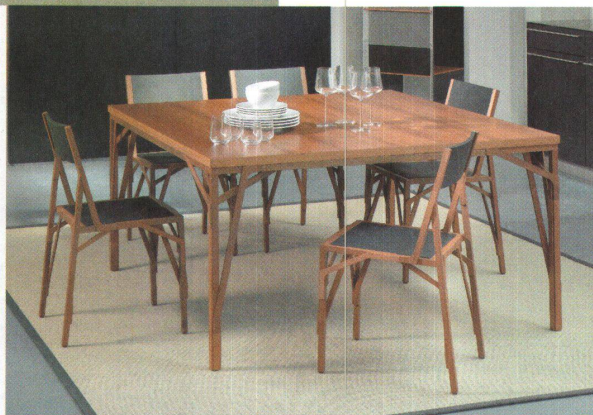
<Atelier Oi entwarfen die Tisch- und Stuhlbeine von «Allumette» als filigranes Fachwerk.