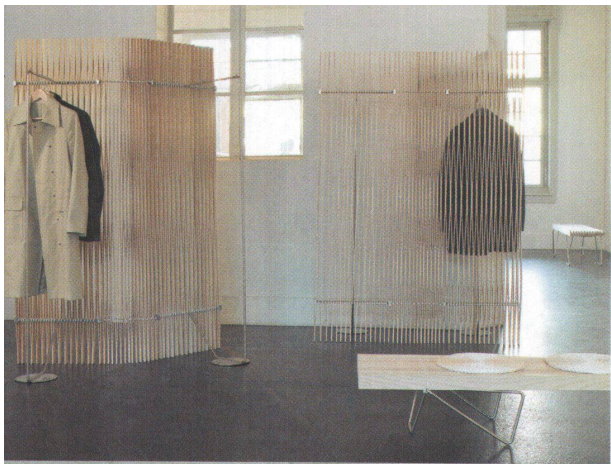
<Bank und Paravent «Plus» von Atelier Oi entstammen demselben Prinzip.