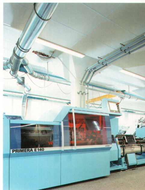
^Blau ist die Farbe für Druckmaschinen. Hier der Sammelhefter «Primera». Auch die Beschriftung wurde überarbeitet.