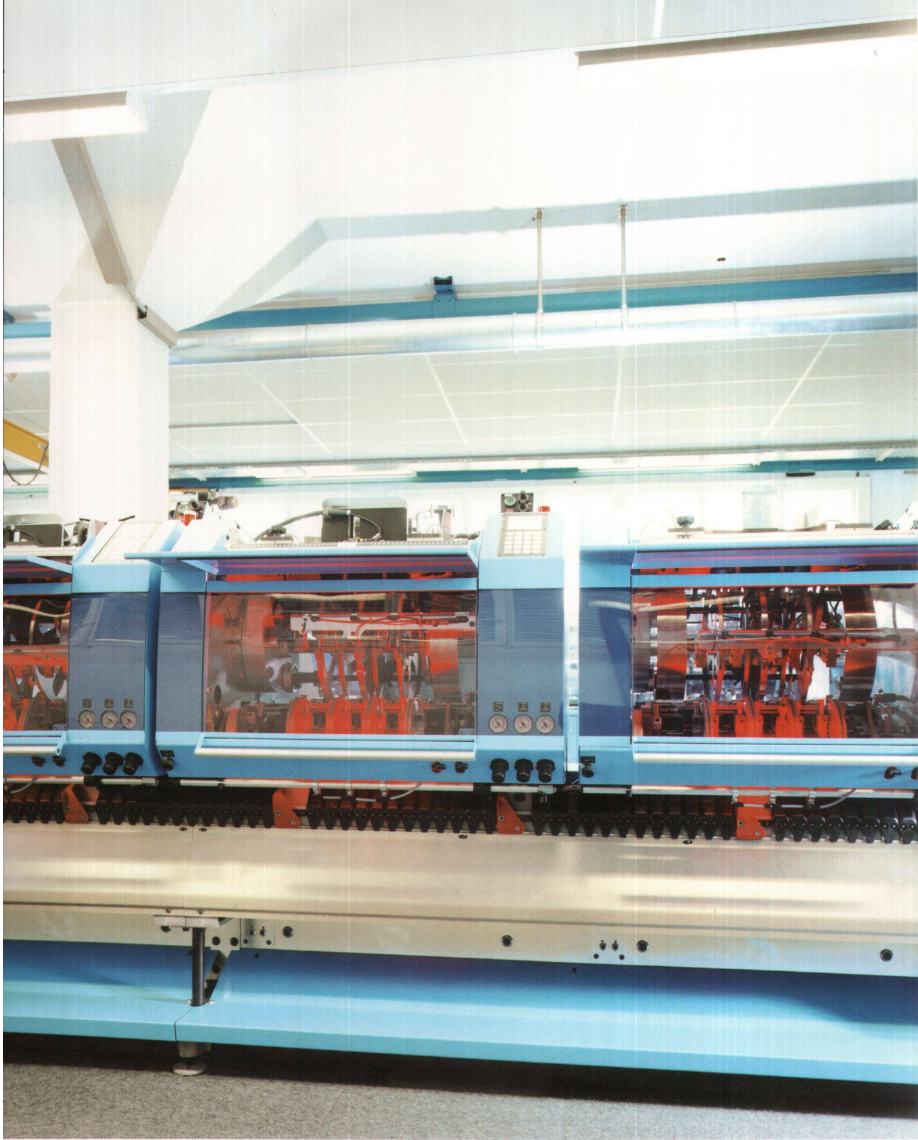
^Die Verschaltung bei diesem Anleger folgt dem Spiel von konvexen und konkaven Flächen.