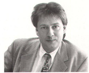
^ Reiner Eichenberger: «Aufhören mit Subventionen der Mobilität.»

Alle reden von Innenentwicklung. Aber wie wollen wir diese Verdichtung umsetzen und was bedeutet es für Städte und Siedlungen, wenn wir damit im grossen Stil beginnen? Wenn etwa in Zürich Platz für weitere Kubikmeter Wohnraum geortet wird – wie können wir diese konkret realisieren? Sicher ist: Wir müssen mit dem Bestand grundlegend anders umgehen. Brachflächen zu revitalisieren, reicht nicht. Um grossflächigen Abriss und Neubau werden wir nicht herumkom-