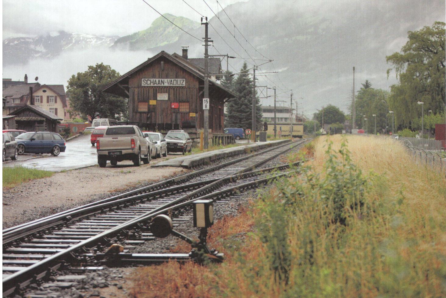
^Eingleisig fährt die Eisenbahn durchs Fürstentum Liechtenstein von Buchs nach Feldkirch.