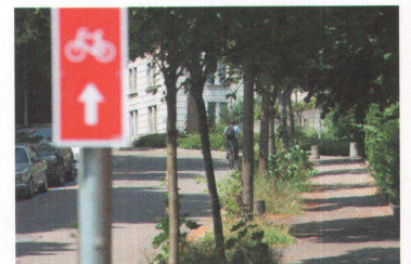
^ ... fast überall perfekt markiert.