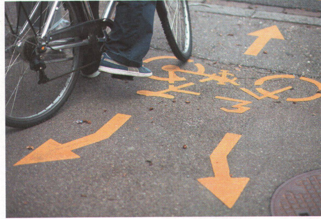
^ Es führen viele Velowege durch die Stadt.