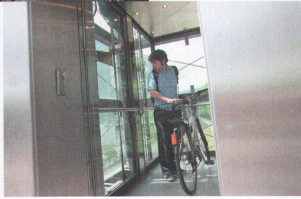
^ Einzigartig in der Stadt: Velolifte zur Überführung über die Sihltalbahn.