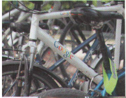
✓ Dienstvelos im Hürlimann-Areal.