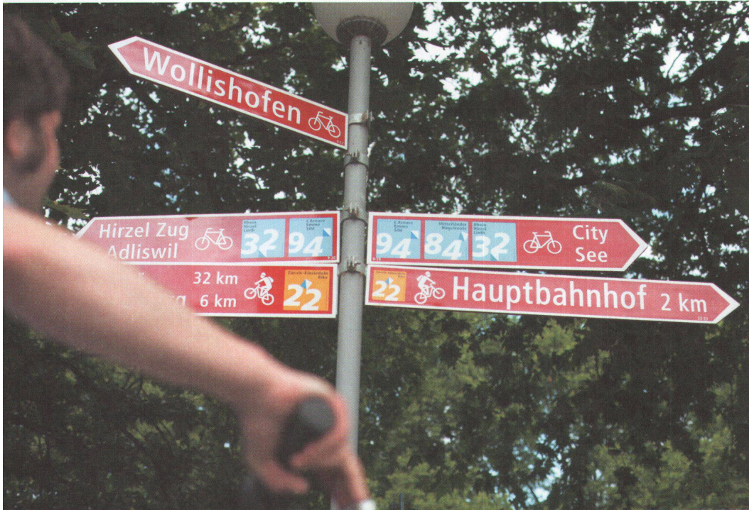
< An der Sihlpromenade verlocken die Wegweiser zum Ausflug nach A wie Adliswil bis Z wie Zug.