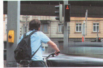
✓ Sicheres Einfädeln in den Stadtverkehr.