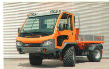
>Market: 35 000 Franken gehen an Paolo Fancelli für den Mehrzwecktransporter «Aebi VT 450».