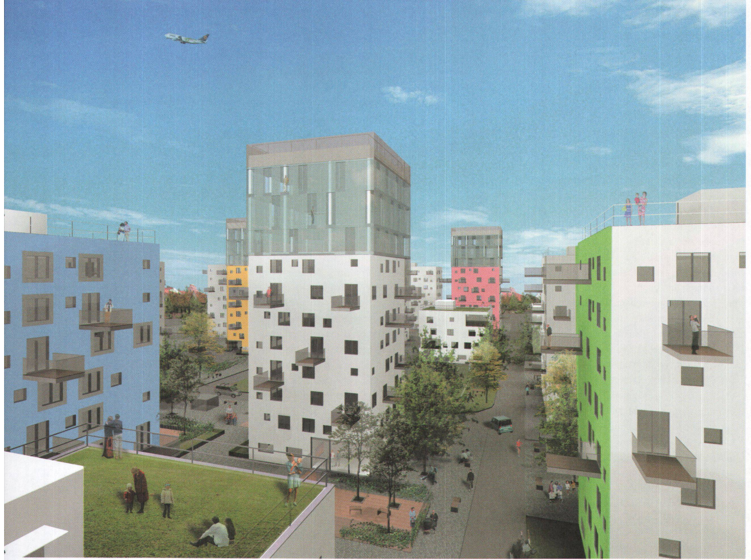
^Mini-Tokio in München: Die Siedlung des bayrischen Werkbunds wird nicht gebaut.