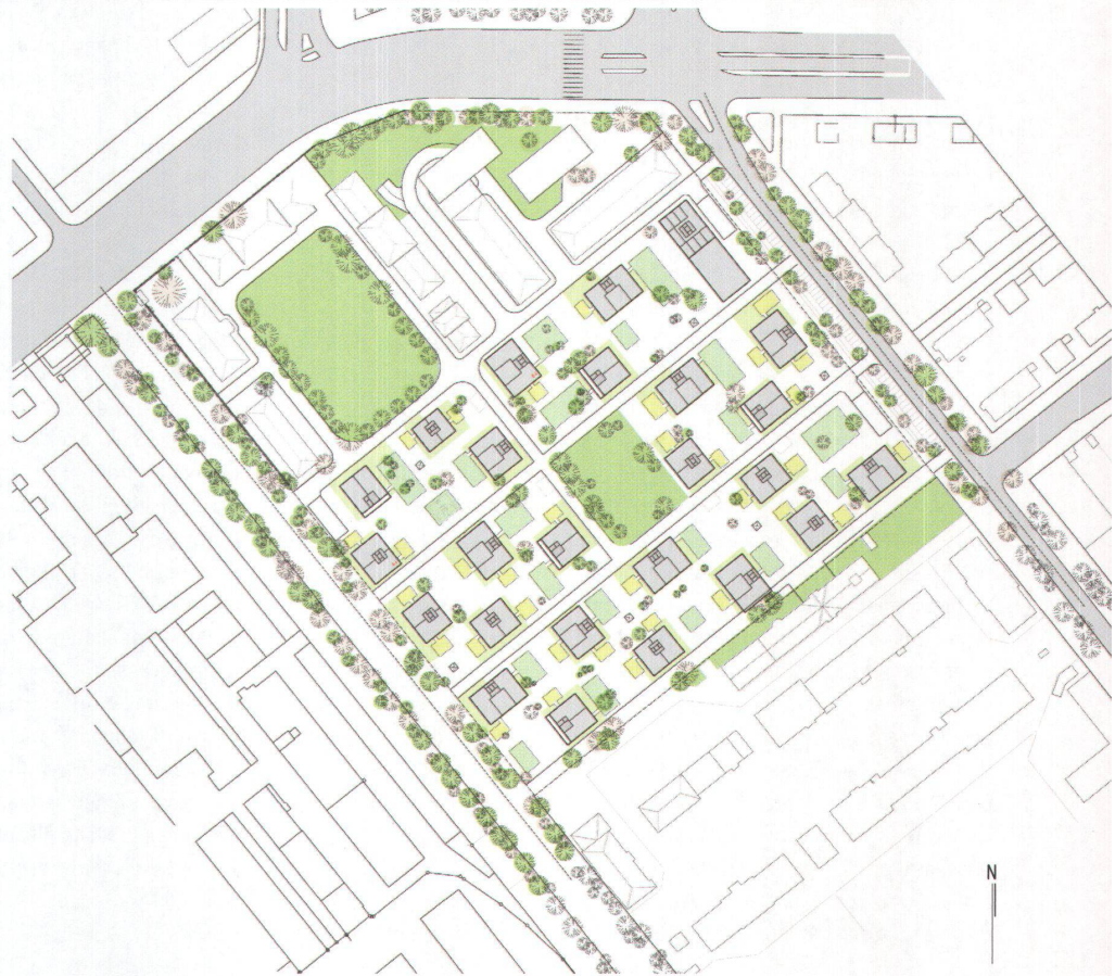
^Situationsplan der Werkbundsiedlung in München. Bilder und Plan: Atelier Kazunari Sakamoto