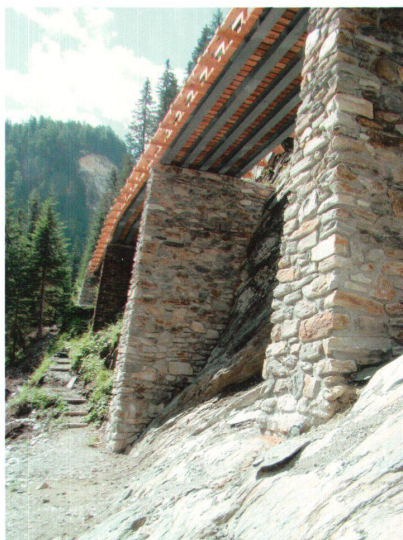
^Die rekonstruierte hölzerne Starlera-Brücke schloss eine Lücke der alten Averserstrasse.

»Einer der schönsten Abschnitte der alten Averserstrasse: die Brücke im Valle di Lei.