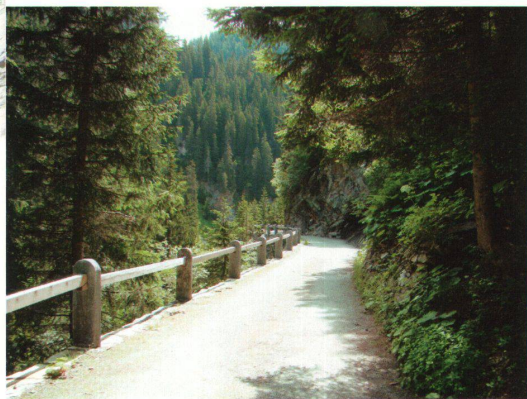
^Zwischen Innerferrera und Avers Cresta wurden Wegstücke saniert und ins Wanderwegnetz integriert.