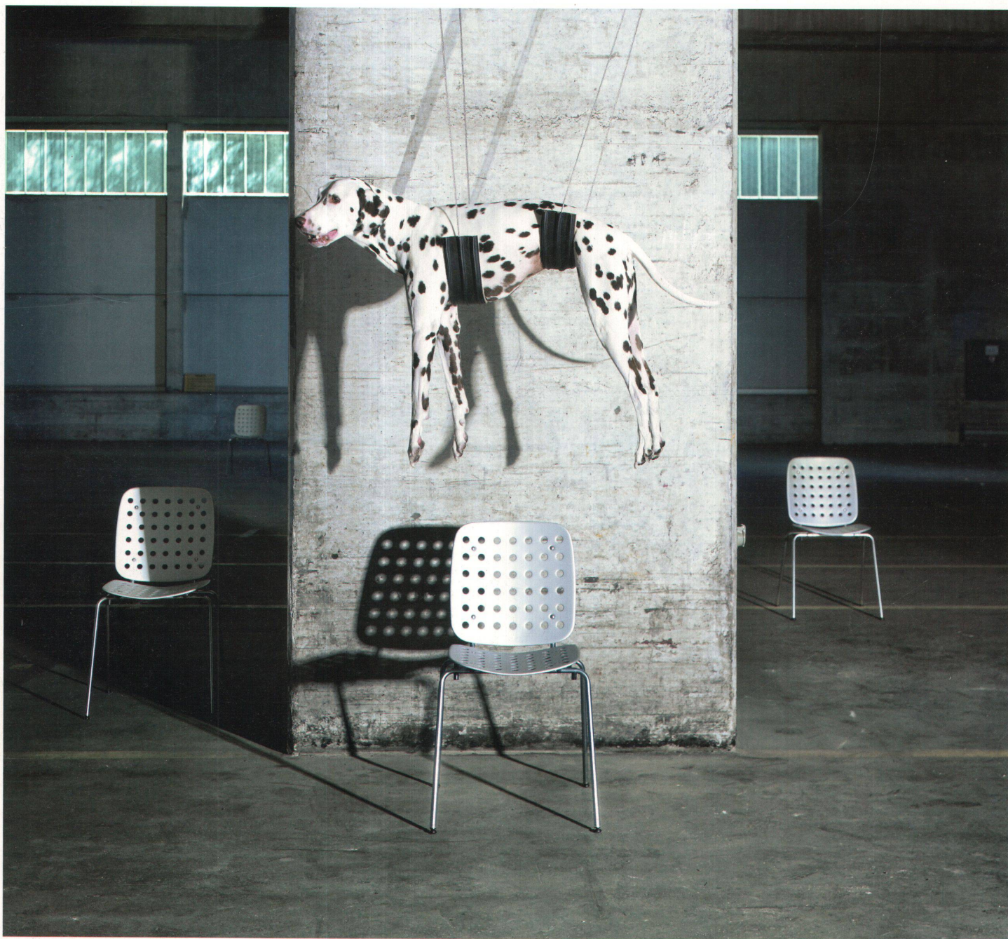
Coray-Stuhl, Design: Hans Coray

Büroplanung & Innenarchitektur, Design & Verkauf CH-3600 Thun, Tel. +41 33 225 55 75, www.daskonzept.ch Mitglied im designarchiv.ch