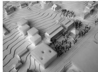
∨Schönwil: Wohnen und Arbeiten neben Park und Denkmal von Diener & Diener.