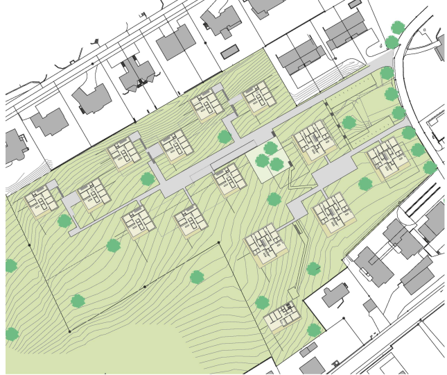
<Binsbösch: Eigentümer und die Architekten Meletta Strelbel weisen nach, dass tiefere Baudichte richtig ist.