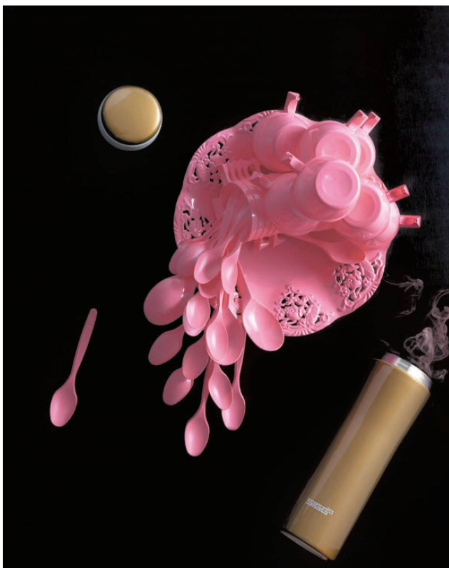
<Lange warm bleibt der Coffee-to-go im Metro Mug von Sigg.