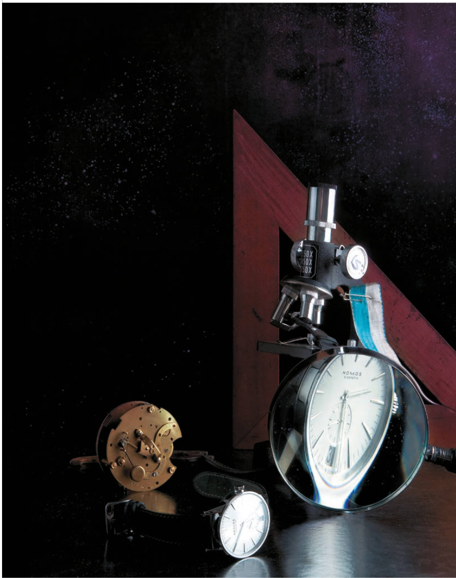
^Der Name täuscht: Diese Uhr ist kein Schweizer Gewächs. Oder besser gesagt: nicht nur.