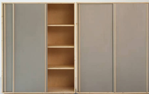
Bild: 2 Schränke, Türen farblackiert.