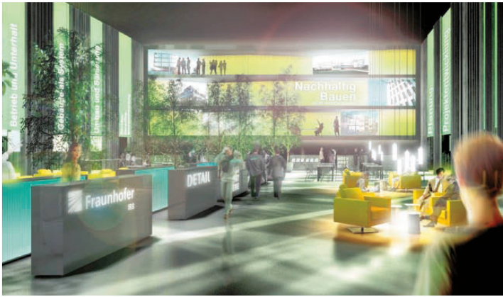
^Entwurf zur Sonderausstellung «Global Building».