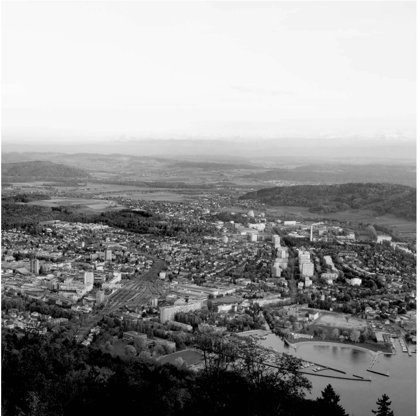
^Biel gehört zu zwei Landschaften: zur Ebene des Seelands und zum Jura. Der Blick von Magglingen aus geht in die Tiefe zum See und in die Weite zu den Alpen.