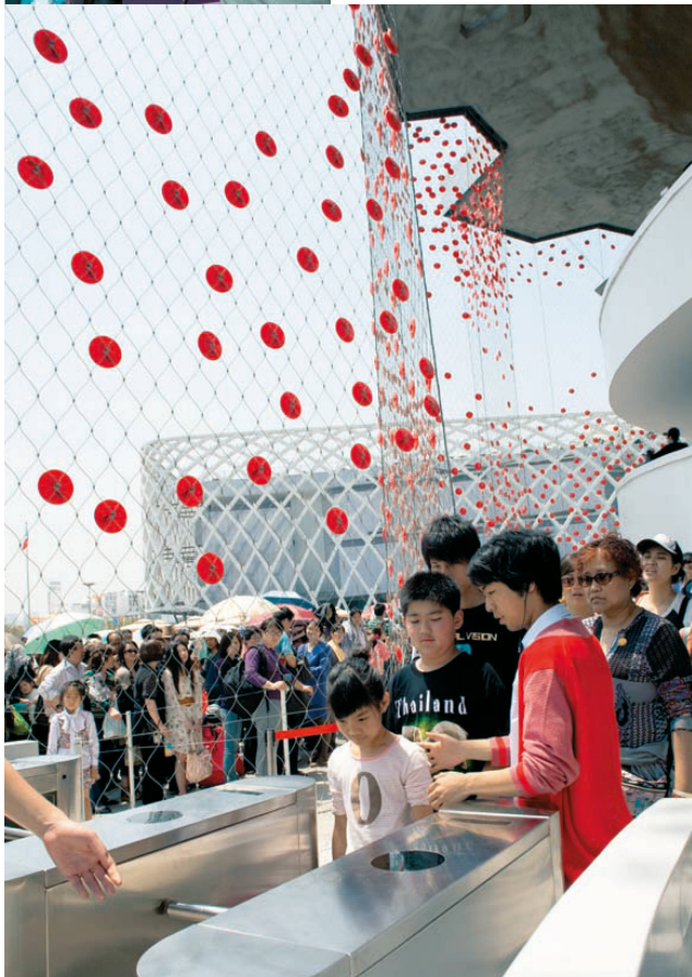
√Sie blinken wirklich: die runden, roten Fotozellen vor der Fassade.