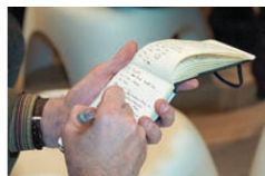
^Stilvoll mitschreiben ins schwarze Moleskine.