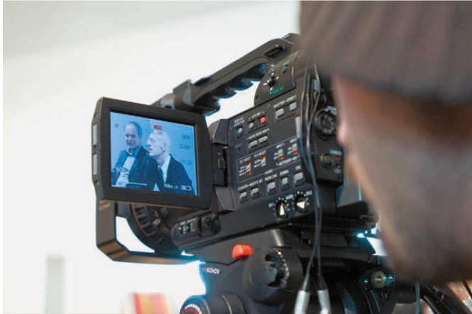
▽Im Fokus: Pierre de Meuron, Jacques Herzog.