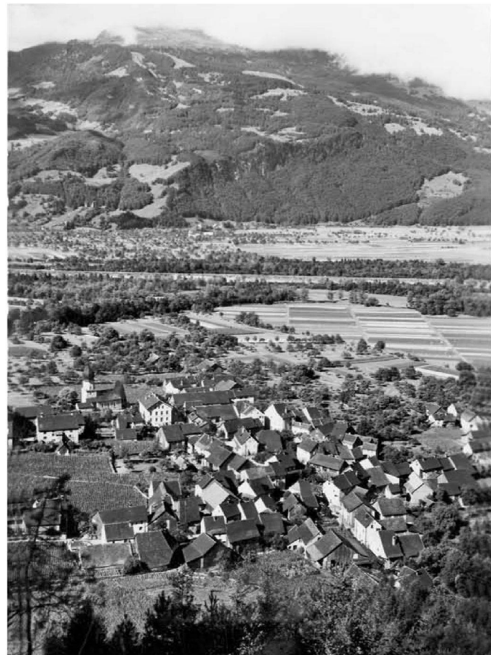
^Fläsch um 1950, eine dicht bebaute Siedlung mit Kirche und Gemeindehaus am Rand und mit Wein- und Baumgärten bis ins Dorf.

Doch solche Erkenntnisse fanden keinen Niederschlag in folgenden Ortsplanungen. Neu-Fläsch wuchs konstant, und die neuen Quartiere unterscheiden sich nicht von der baulichen und räumlichen Beliebigkeit anderer Einfamilienhaus-Agglomerationen landaus, landein. Das Dilemma: Die Weinbaulandschaft als Arkadien in der Agglomeration ist Segen und Fluch der Erfolgsgeschichte des «Herrschaftler» Weinbaus und der hohen Attraktivität als gediegener Sonnenplatz der Agglomerationspendler.