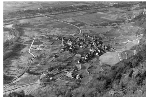
▼ Fläsch 1976 – ein verträumtes, in sich geschlossenes Dörflein vor der Landnahme durch die Einfamilienhäuser.

NEUE «HERRSCHÄFTLER» WEINBAU-ÄRA Die ersten neuen Fläscher Weinbauern betrieben den Weinbau wie eh und je: Ihre «Herrschaftler» waren anspruchslöse Landweine, nur wenige Winzer bauten ihre Weine selber aus, die meisten verkauften ihre Trauben an grosse Weinkellereien. >>