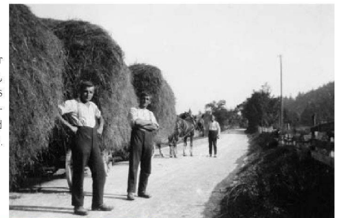
>Heuzug. Die Fläscher hatten Wiesen, «Ländereia», bis ins Fürstentum Liechtenstein zu pflegen und zu ernten.