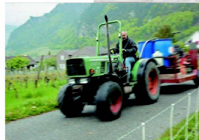
<Winzerzug. Statt Ochsen und Pferden sind die wendigen Weinbautraktoren unterwegs.