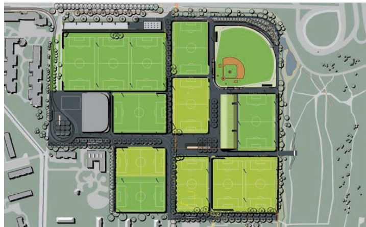
< Ein Patchwork in Grüntönen: die erneuerte Sportanlage Heerenschürli in Zürich Schwamendingen.