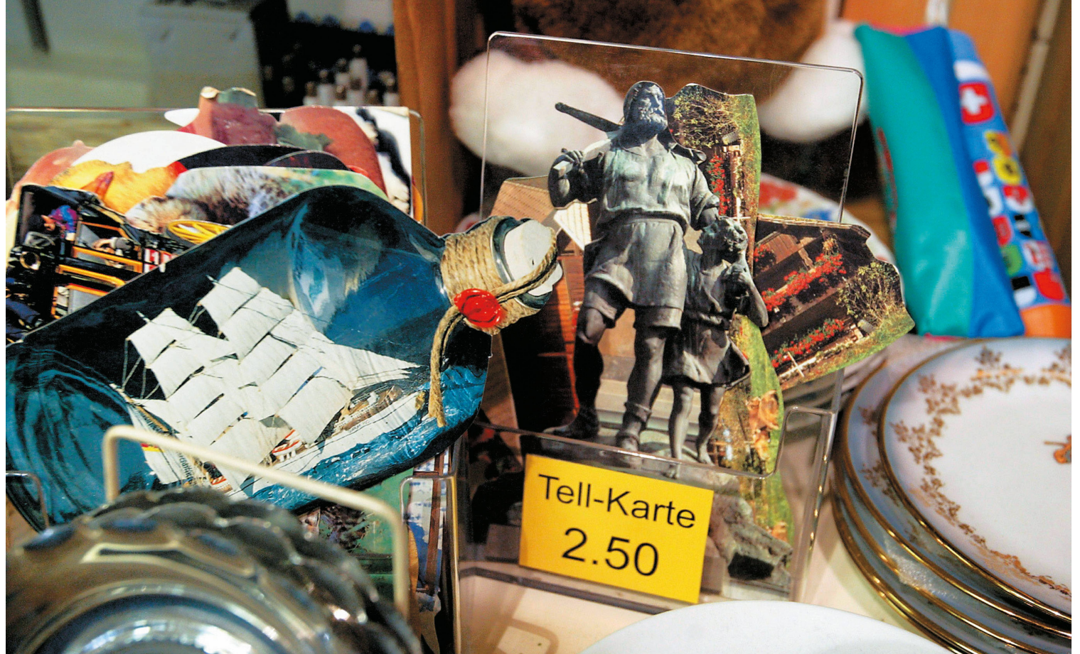
^ In der Masse austauschbar, für den Besitzer einmalig: Lohnt sich die Gute Form bei Souvenirs?

liert. Weiter spielt die formale Umsetzung eine Rolle: Das Brandenburger Tor gibt es als Schneekugel, als Bastelbogen oder als Bürste, bei der die Borstenbündel die Säulen darstellen. Die Übersetzung eines Motivs in ein Souvenir reicht von naturalistisch-abbildhaft bis zu abstrakt, von naiv-kindlich bis ironisch: Das spricht unterschiedliche Touristen an.