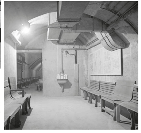
> Spartanisch war der Aufenthaltsraum der Generaldirektion eingerichtet.