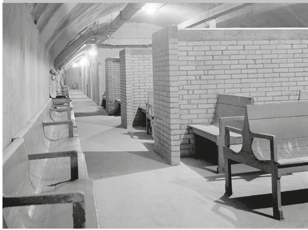
^ Von der Öffentlichkeit unbemerkt: die Luftschutzanlagen unter der Grossen Schanze aus dem Zweiten Weltkrieg.