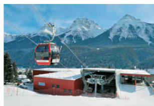
< Das Truckli im Tal: Die Talstation der Gondelbahn Motta Naluns in Scuol GR.