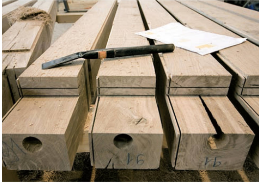
^Auch dünne Stämme werden zu Balken: Das kernlose Laubholz trocknet schneller und reisst weniger stark.