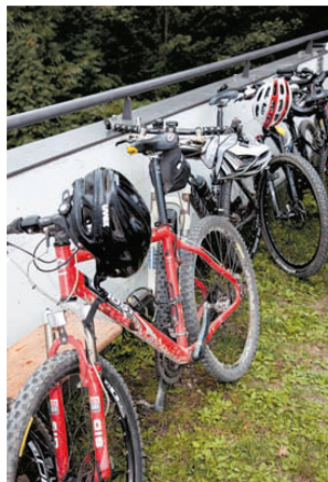
>Nach dem Rennen: Helm ab!