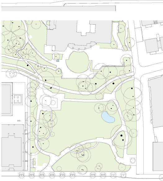
<2006: Seit den Siebzigerjahren blickt das Altersheim über den Park, der seine ursprüngliche Form verloren hat.