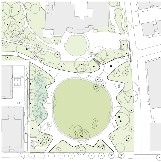
«Seite 20 Ein leicht mit der Topografie schwingendes Rasenfeld bildet das Herz des Brühlgutparks in Winterthur.