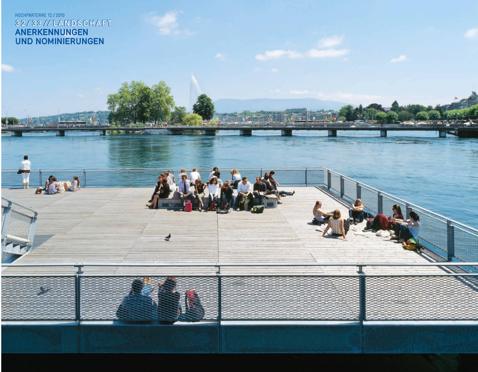
^Genfs neuer Stadtbalkon über dem Wasser: die Plattform am Pont de la Machine.