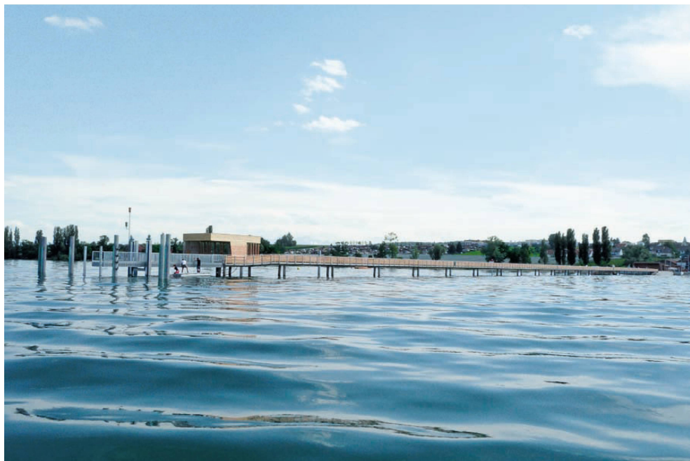
^Jetzt legen die Bodenseeschiffe auch hier an: der 250 Meter lange Schiffssteg in Altnau.

Um 1760 erhielt der Park des ehemaligen Landsitzes Brännengut sein barockes Gepräge. Seit Mitte der Achtzigerjahre, als die Autobahn durch das Areal gebaut und anschliessend überdeckt wurde, ist der Park eine öffentliche Grünanlage. Mit dem Bau des Stadtquartiers Brünen wurde aus dem peripheren Park ein zentraler Grünraum für 12 000 Einwohnerinnen und Einwohner. Ebenfalls zum Park gehören ein Fussballfeld und ein Trainingsplatz, ein Platz für >>