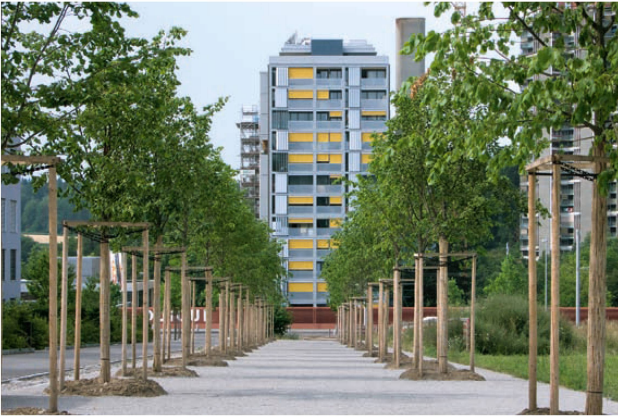
^Ein zentraler Grünraum für 12 000 Bernerinnen und Berner: die Parkanlage Brännengut im Westen der Bundesstadt.

PONT DE LA MACHINE UND PLATTFORM, GENÈVE, 2009 Der Pont de la Machine ist eine bequeme Fussgänger- verbindung über die Rhone im Zentrum Genfs. Die Brücke entstand Ende des 19. Jahrhunderts, als Genf den Fluss grundlegend umgestaltete, einerseits um das Wasser zu nutzen, andererseits um den See- spiegel zu regulieren. Teil des Unternehmens war auch das Maschinengebäude, das die Brücke flankiert. Im Rahmen des Projekts «le Fil du Rhône», mit dem die Stadt Fussgängerpassagen, Quais und Plätze auf- wertet (und dafür den Wakkerpreis 2000 erhielt), wurde die Brücke nun sorgfältig saniert und mit einer Plattform über dem Wasser ergänzt.