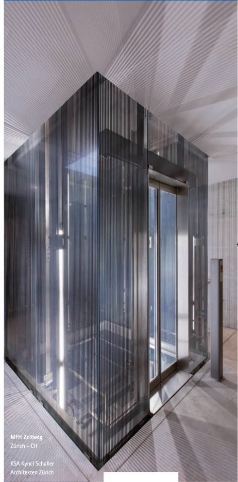
MFH Zeitweg Zürich - CH KSA Kynel Schaller Architekten Zürich

Life bauen ist unsere Stärke. Das zeigt sich gerade bei architektonisch und konzeptionell anspruchsvollen Projekten. Wir setzen Ihre Vision um.