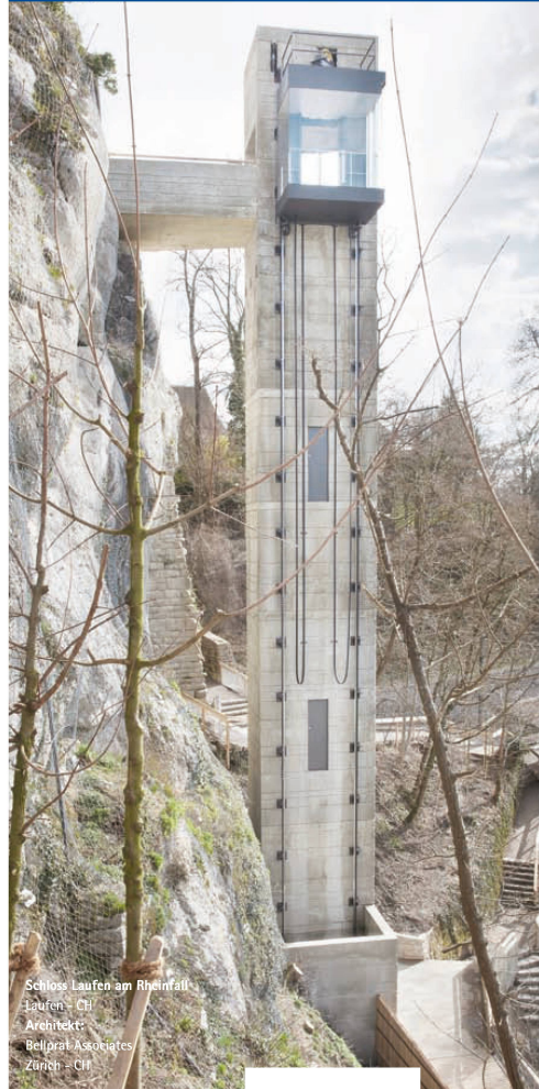
Schluss Laufen am Rheinflall Laufen - CH Architekt: Bellprat Associates Zürich - CH