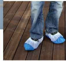
^Das Accessoire des Tages: Überzüge für die Schuhe.