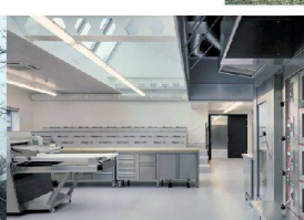
<47_ Bäckerfachschule Richemont.