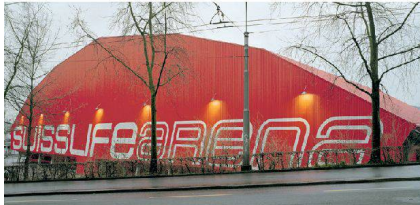
✓45_ Eiszentrum Swisslifearena.