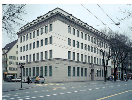
^46_ Sammlung Rosengart.