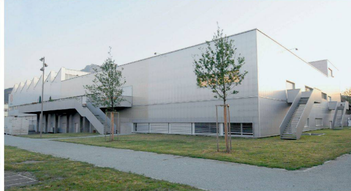
<41_ Kulturzentrum Südpol.