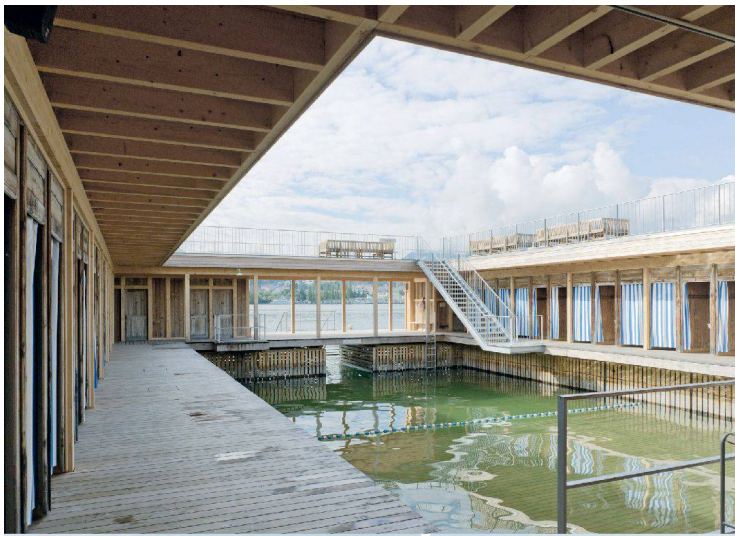
<37_ Seebad am Nationalquai.