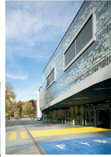
<39_ Verkehrshaus, Eingangsgebäude.