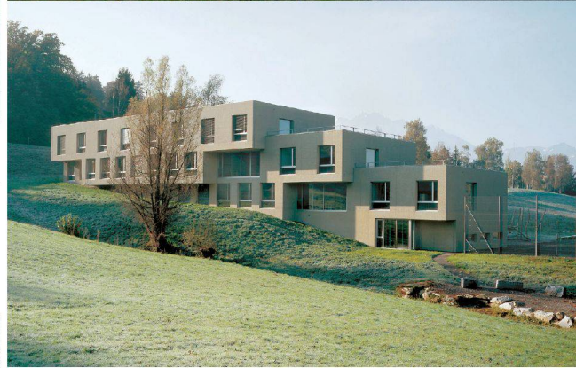
>42_ Schulhaus Unterlöchli.