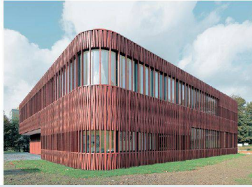
✓38_ Schulhaus Büttenen.