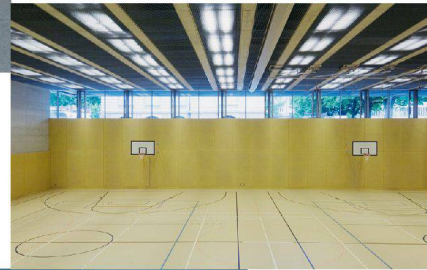
^43_ Doppelturnhalle Säli.