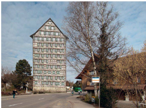
BAHNHOF BERN: BAUTEN, PLÄNE UND KONTROVERSEN