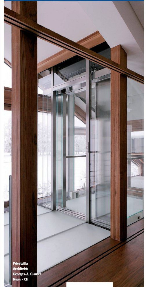
Privatvilla Architekt: Georges-A. Glauser Nyon - CH

Das zeigt sich gerade bei architektonisch und konzeptionell anspruchsvollen Projekten. Wir setzen Ihre Vision um.