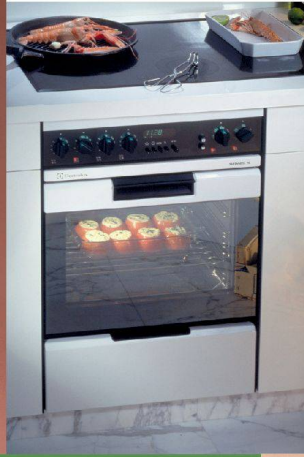
<Einbauherd «SL Swissline» für Electrolux, 1985.