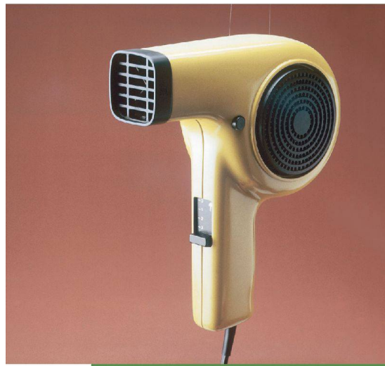
<Haartrockner «Miostar» für Spemot, 1978.