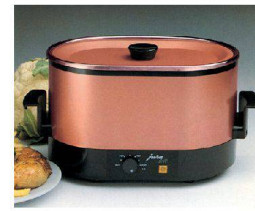
^Friteuse für Single-Haushalt «Jurafit» für Jura, 1989.