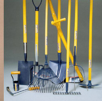
^Farb- und Bechriftungskonzept für Gartengeräte, Migros, 1986/1987.