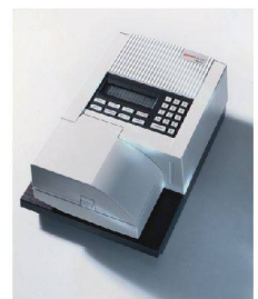
^Low-End Frankiermaschine «Smile» für den US-Markt, Ascom-Hasler, 1994.